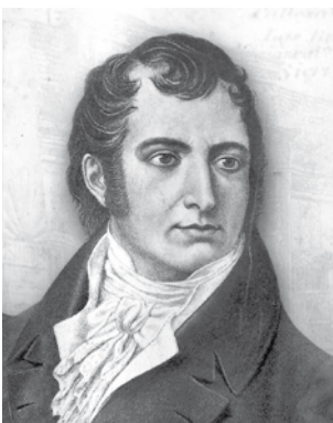
Juan José Castelli