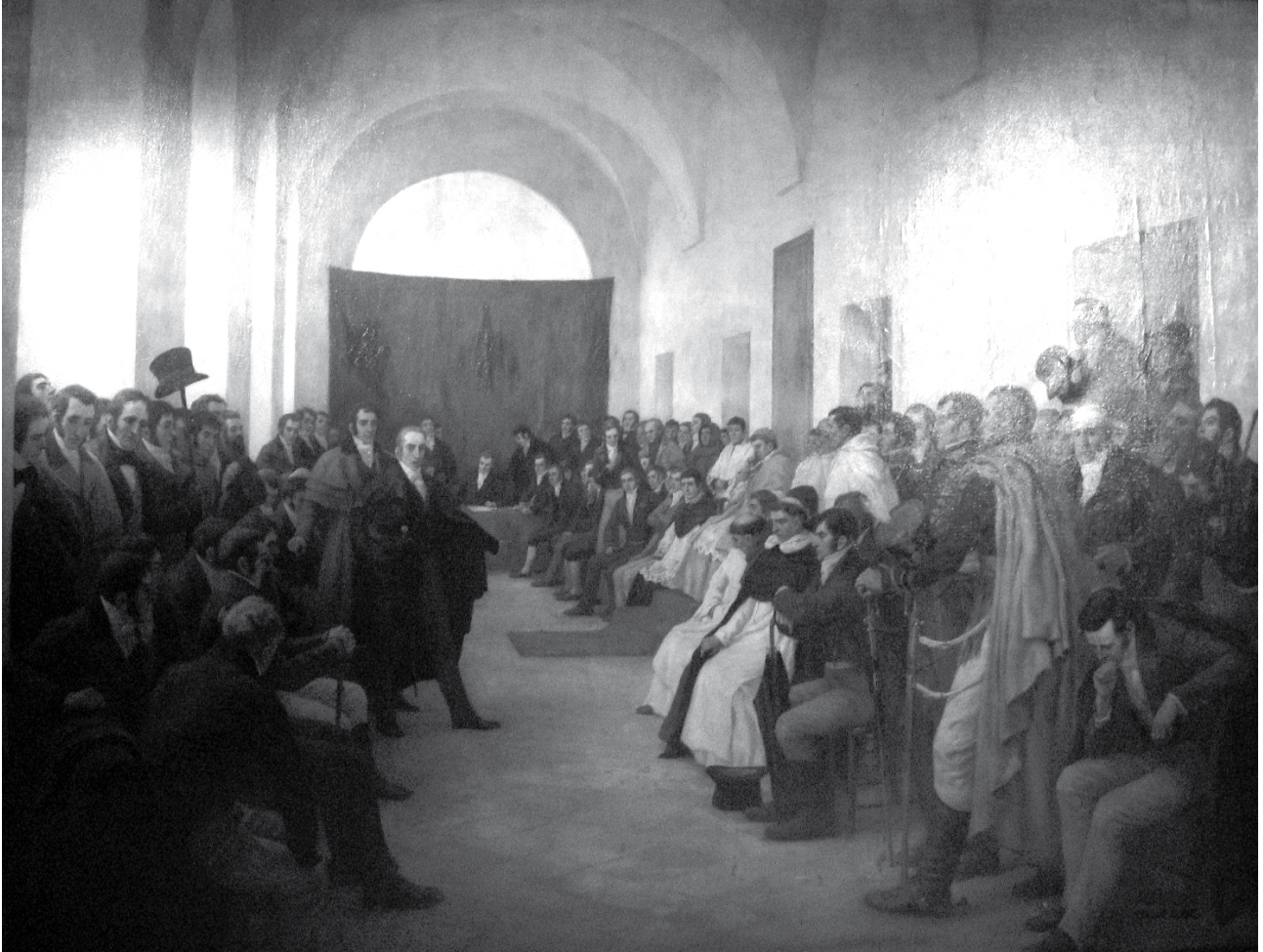
El Cabildo Abierto del 22 de mayo, óleo de Pedro Subercaseaux (este apellido se pronuncia subercasó).

El Cabildo Abierto era una reunión de vecinos que tenía como fin discutir algún asunto considerado de gran importancia. No era una reunión abierta a todos los habitantes de la ciudad: solo participaban los varones adultos que fueran reconocidos como personas que ocupaban una posición social importante, como los comerciantes, funcionarios, militares, profesionales, clérigos o propietarios.